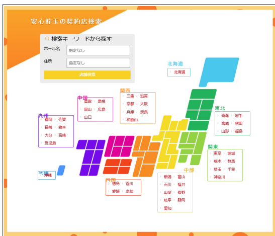
安心貯玉.com WEB サイト 安心貯玉契約店検索ページ https://www.anshinchodama.com/map/

貯玉会員の利益が保護される「安心貯玉の契約店(第三者貯玉保証管理制度)」は「安心貯玉.com」「貯玉補償基金」のWEBサイトで周知しています。